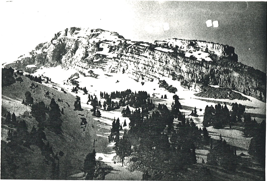
La Moucherolle vue du refuge.