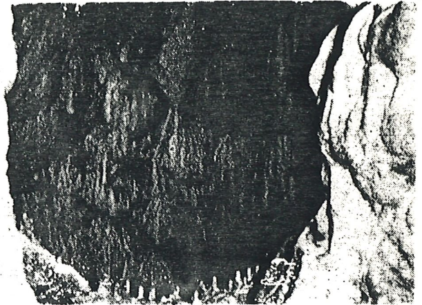
De superbes concrétions dans les galeries de la Croix-Rousse