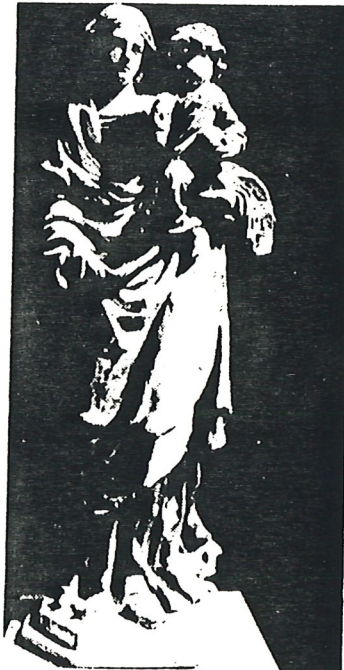
L'une des vierges du musée marial de Fourvière qui possède une belle collection de vierges polychromes, notamment du XIV e siècle.